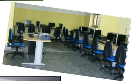
AULA DI INFORMATICA