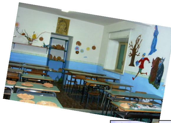
LABORATORIO DI CERAMICA

Preparazione per sostenere l'esame con un ente certificatore attestante il rag-