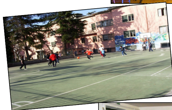
SPAZI PER ATTIVITÀ SPORTIVE